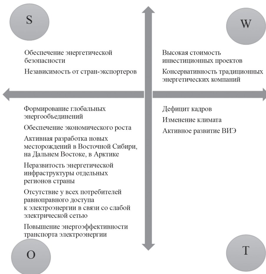
Рис. 1. SWOT-анализ наиболее значимых вызовов

экономического роста, появление новых центров экономического развития в Азии и Латинской Америке влекут за собой перемещение мировых центров потребления электроэнергии населением и промышленностью в новые части света [4, 5].